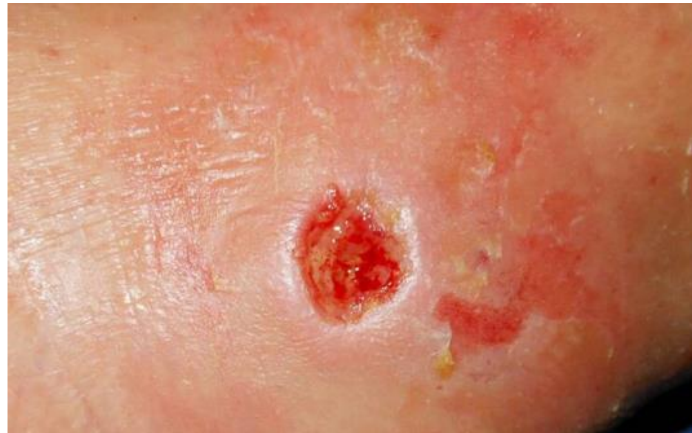
z.B. Verbrennung/ chronische Wunden