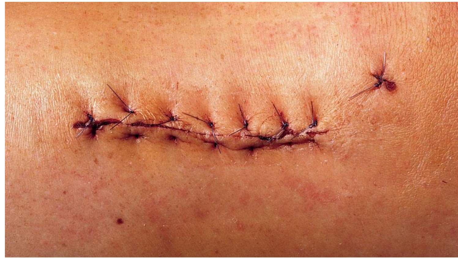
z.B. OP-Naht, frische Schnittverletzung