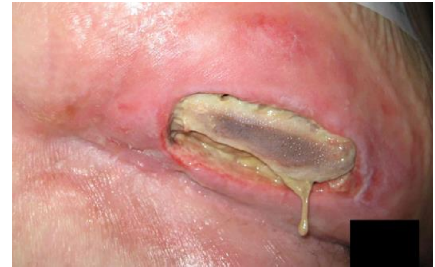
z.B. infiziertes Ulcus cruris